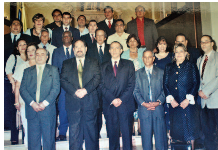
Junta Directiva del Colegio de Médicos del Distrito Federal, hoy Metropolitano de Caracas electa en mayo 1998 y otros colegas en un acto oficial. P/02